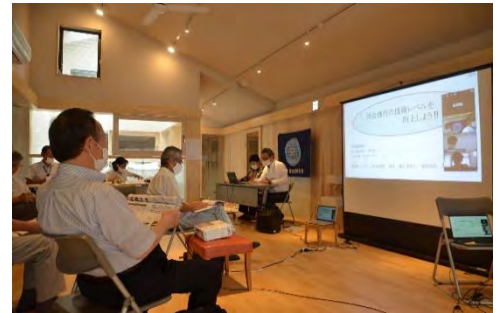
上記写真はQC発表会の様子