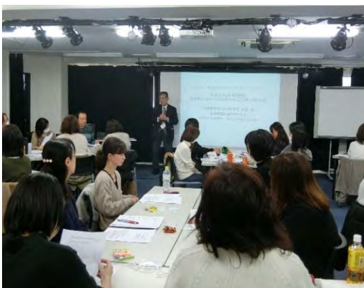
上記写真は昨年度のキャリアアップ研修の様子

来年度の開催につきましては、現在どの分野の研修(1乳児保育2幼児教育3障害児保育4食育・アレルギー5保健衛生・安全対策6保護者支援・子育て支援7マネジメント8保育実践)を希望するかについて今まで受講したことのある保育園に対してアンケートを取っております。結果を踏まえて、東京都保育士等キャリアアップ研修を可能な範囲で計画する予定です。募集の際にはホームページ( https://tokyo.dswi.jp )に記載致します。